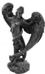
Imagem de Lilith

Como montar um altar para Lilith Primeiramente devemos ressaltar que o altar de Lilith deve ser montado exclusivamente para ela, nunca divida seu altar com outra entidade, divindade ou demônio, jamais faça "assentamento" ou ofertas no chão, seu altar deve ser fixado sobre um móvel em um lugar onde possam ser feitas suas ofertas e rituais. O altar pode ser coberto por um pano vermelho ou preto.